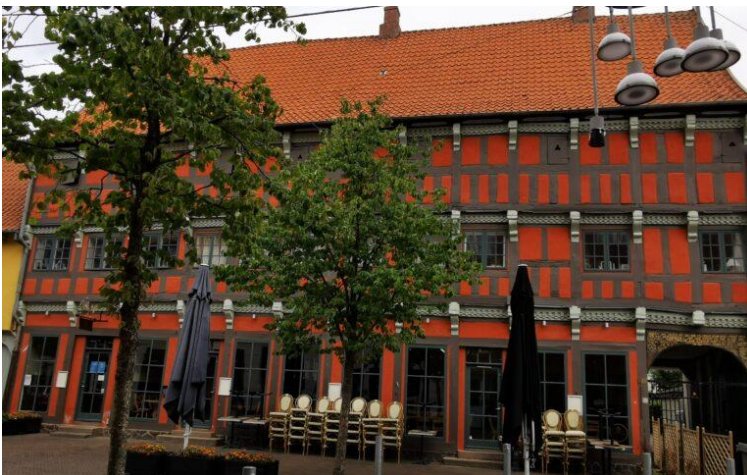
Storegade 13 i Randers, som kaldes Niels Ebbesens hus. Bemærk Niels Ebbesen til hest.